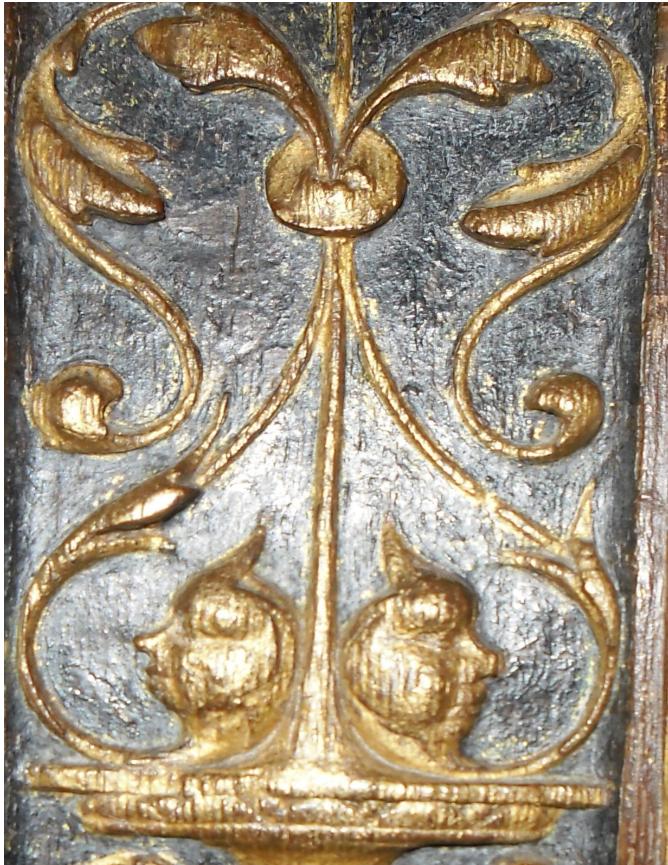
Aliens casqués dans leur vaisseau