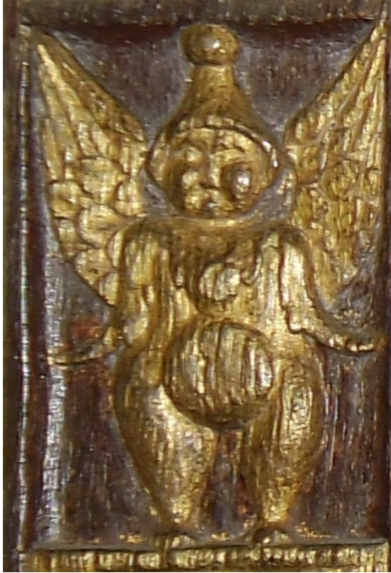
Humain ailé casqué style chérubin