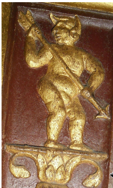
Alien casqué avec une flèche pour rappeler le vol